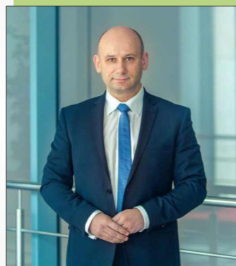
Marcin Witko - Prezydent Tomaszowa Mazowieckiego

Wartość dofinansowania z Funduszu Spójności: 101.370.724,91 zł