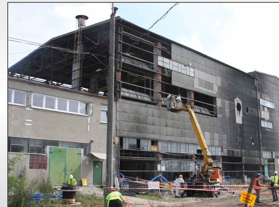
Fot. Modernizacja oczyszczalni ścieków przy ul. Henrykowskiej

Rozstrzygnięty został przetarg na ostatni już Kontrakt VIII w ramach realizowanego Projektu, dotyczący opracowania koncepcji ostatecznego rozwiązania problemu osadów zdeponowanych na lagunach. Wykonawcą została firma CONSEKO-SAFEGE S.A. z Krakowa.