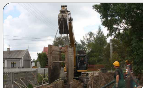
Fot. Realizacja Projektu w ul. Krzywej