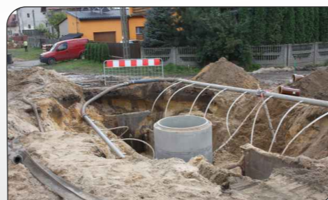
Fot. Realizacja Projektu w ul. Grażyny