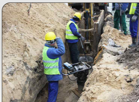
Fot. Etapy realizacji Projektu przy ul. Tomaszowskiej