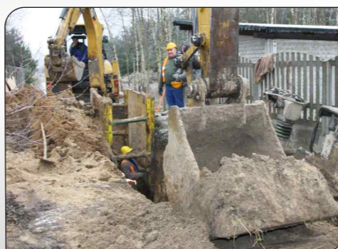
Fot. Etapy realizacji Projektu przy ul. Sadowej